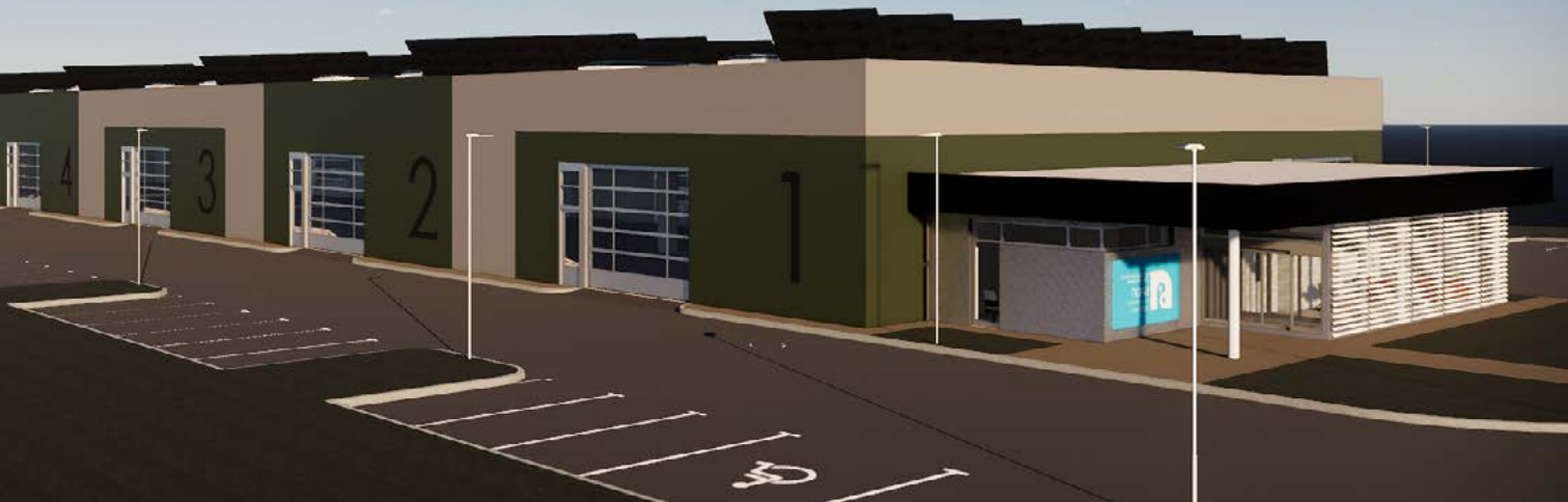
▶ BUSINESS INCUBATOR